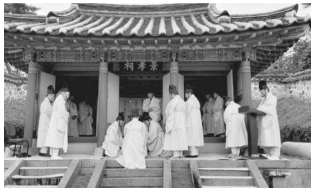
(入郷) 후 후손들의 노력과 지방유림들이 협조로 창건한 후 300년 넘게 보존 관리해오고 있다.

백목서원은 남강(南崗) 선생의 학문과 덕행을 추모하기 위해 1710년(숙종 36년) 후손 및 지역 유림들이 창건하고, 대원군의 서원철폐령으로 철폐되었다가 해방 후 후손과 유림들의 노력으로 복원하였으며 1965년도에 보수하였다. 백목서원은 2015년 4월 17일 향도유적 제96호로 지정되었다. 남강공의 손자인 도사공(都事公, 필종必宗)이 청주 옥산면으로 입향