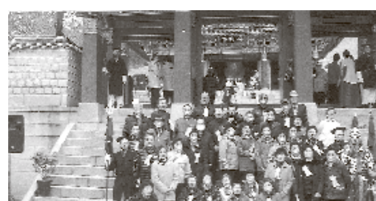
의성서부중친회 회원들이 총정사를 참배하고 기념촬영 했다.

의성서부중친회는 지난 3월14일 회원 48명이 관광차편으로 경기도 행주산성에 도착해 총장공 권윤도원 수 제419차 행주대침대에 참석했다. 이날 참례 제3차 정기총회를 대체했으며 자기회장에 권영창씨