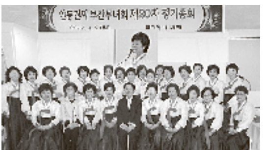
4월9일 부산 코리아호텔에서 부산부녀회 정기총회 기념촬영.

부산 부녀회는 지난 4월 9일 오후 6시반에 연산동 코리아호텔 12층 부페에서 일족 및 회원 60여 참석하여 제20차 정기총회를 개최하였다.