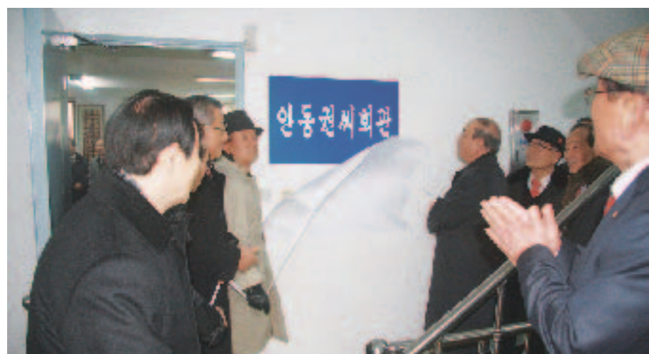
2011년 1월 27일 안동권씨회관 헌판식(동대문구 용두동)