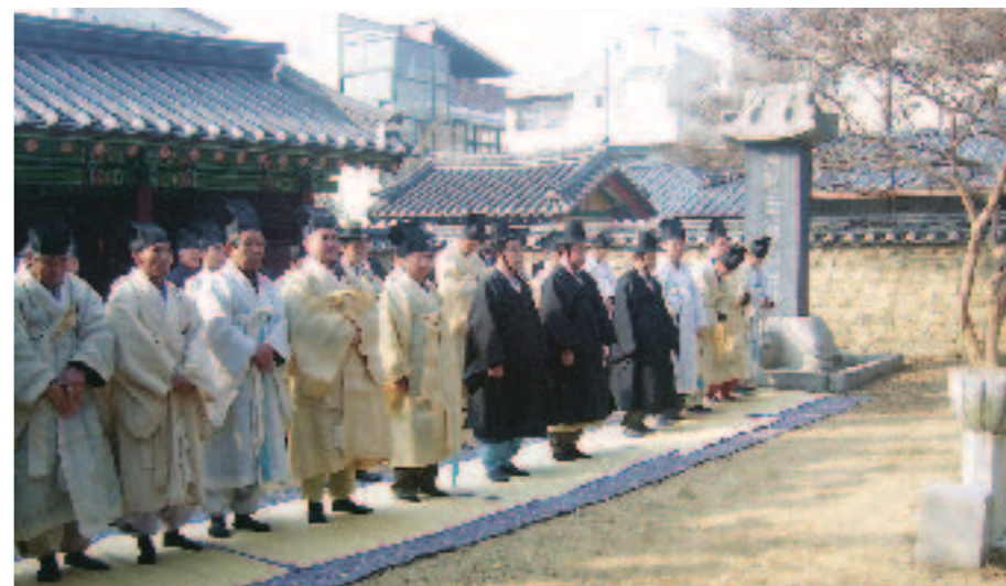
안동북문동 태사묘에서 三姓의 후손들이 「신묘년 정알례」를 올리기 위해 도열하고 있다.

지난 2월 5일(토)인 음력 정월 초3일 10시 태사묘(太師廟)에서 삼성(三姓)<권씨(權氏), 김씨(金氏), 장씨(張氏)>의 후손(後孫)들 50여명이 참석한 가운데 신묘년(辛卯年) 정알례(正謁禮)를 올렸다.