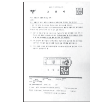
고양시에서 안동권씨 대중회에 회신한 문서