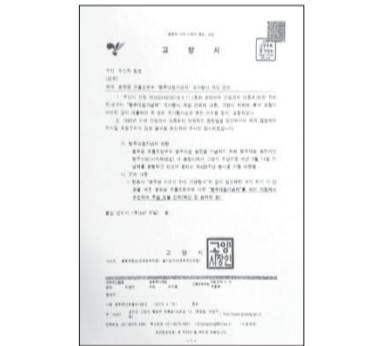
고양시에서 문화재청장과 경기도지사에게 건의한 문서

지방자치단체인 고양시가 행주대첩제를 국가행사로 격상시켜 줄 것을 관계기관에 건의함에 따라 앞으로 대중회에서는 고양시와 상호 협력하여 지속적으로 행주대첩제 국가행사 격상을 추진할 계획이다.