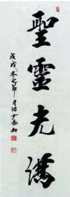
초대작가우수상을 받은 글씨 '성령종민'

서울 사회복지대학원대학교 서예 문인화 지도과정을 졸업하고 현재 한국서화작가협회 이사로 활동하며 고령에도 불구하고 왕성하게 작가활동을 하고 있다. 전국에 수많은 서화작가협회가 있지만 한국서화작가협회는 우리나라에서 다섯 손가락 안에 드는 44년의 역사와 전통을 자랑하는 협회로 알려져 있다.