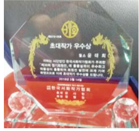
초대작가우수상을 받은 글씨 '성령종민'

서울 사회복지대학원대학교 서예 문인화 지도과정을 졸업하고 현재 한국서화작가협회 이사로 활동하며 고령에도 불구하고 왕성하게 작가활동을 하고 있다. 전국에 수많은 서화작가협회가 있지만 한국서화작가협회는 우리나라에서 다섯 손가락 안에 드는 44년의 역사와 전통을 자랑하는 협회로 알려져 있다.