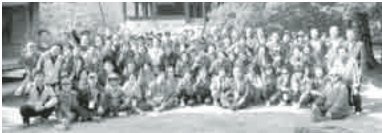
△"봉화 닭살마을 청암정"앞에서