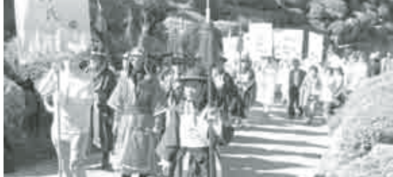
△효뿌리 문화 축제에 안동권씨의 입장식

이 행사는 효문화 중심도시 대전중구청이 주최하고 대전효문화뿌리축제추진위원회 주관으로 지난 9일 오전 10시 장수마을 만성고 앞에서 한국의 226개 성씨(宗)에 130여개 성씨가 성씨기(姓氏旗)를 선두로 4,000여명이 각 문중의 궁지와 우수성을 알리는 우장한 문중 퍼레이드에 우리 안동권씨문중(102번째)로 권박원 대전 종친회장 및 족친 100여명이 도복을 입고 참석하여 권을도원수 영정, 권씨의 유래, 자랑, 유적소개 등 퍼켓(9개)을 들고 입장해 문중의 위상을 한층 더 높였다. 또한 이날 오후 3시경 문중화합 시상식에서 대전종친회가 문중 130개 참가 중, 우수상을 수상해 영광을 안기도 했다.