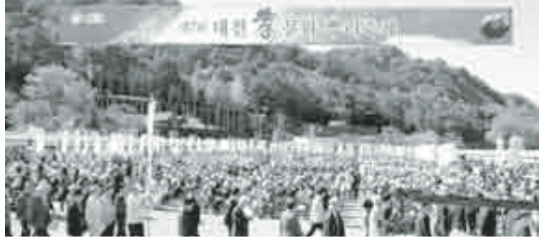
△효 문화 뿌리 축제 전경

효월드, 어른을 공경하고 부모와 가족의 소중함을 느낄 수 있는 인성교육의 장으로써 젊은이와 어른들이 함께하는 화합의 세상을 만들기 주제로 지난 10월 9-11일, 대전 뿌리 공원 잔디광장에서 연인원 35만여명이 참석한 가운데 제7회 대전 孝문화뿌리축제가 성대하게 개최되었다.